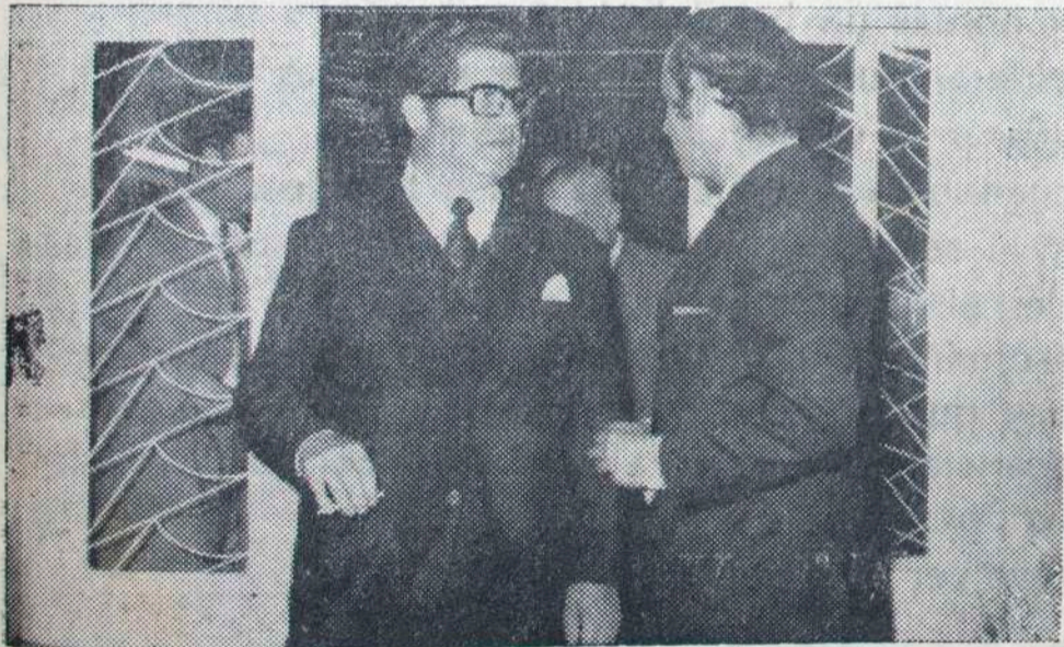
El Gobernador sale de la casa Municipal