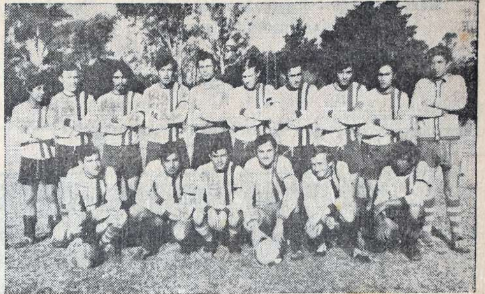
Foto del cuadro de Nobleza donde figuran la mayoría de los jugadores que formaron el equipo que se impuso al de Racing por 3 a 0 en la disputa del trofeo «Ciudad de Ramírez»