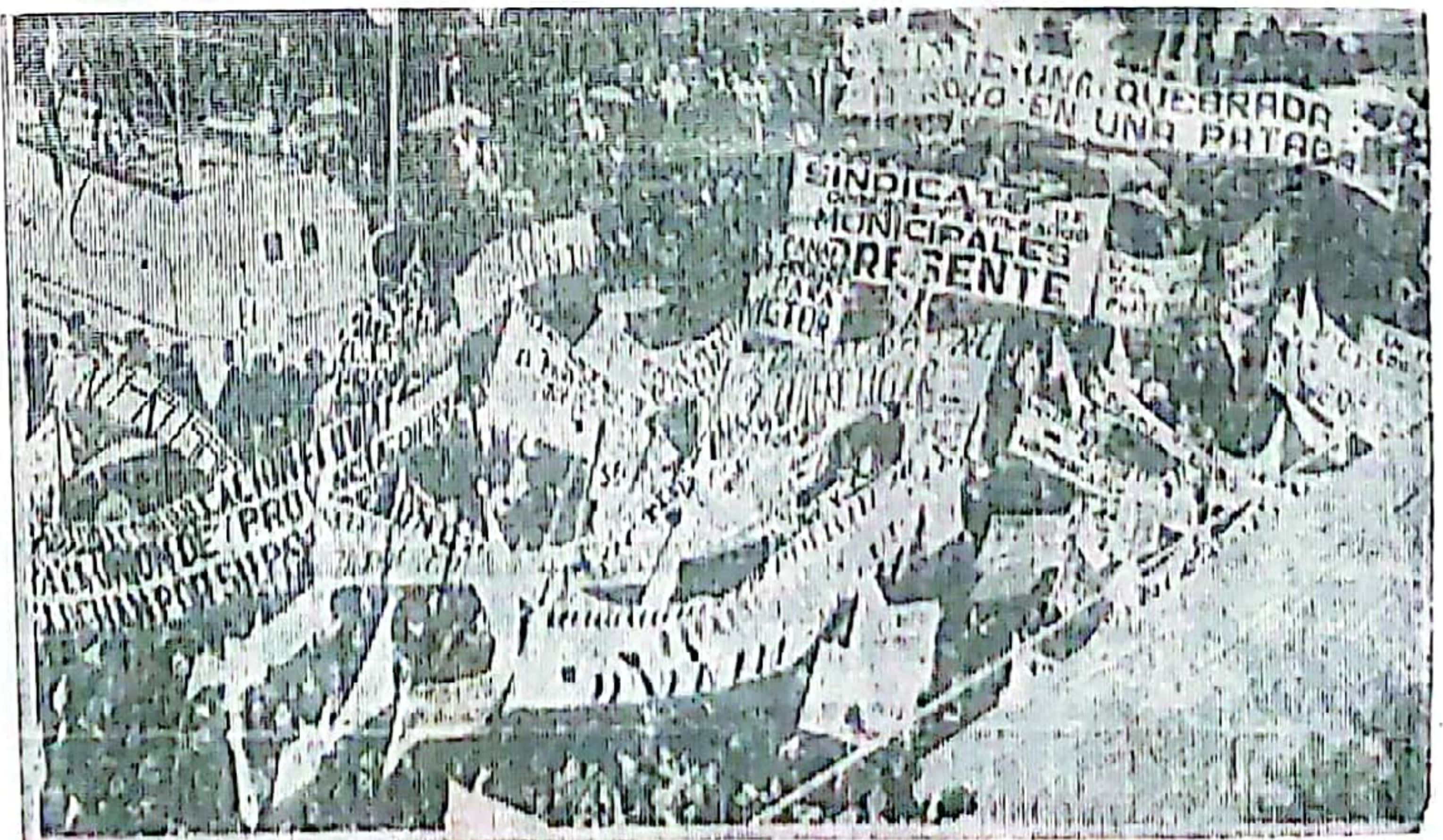
Foto tomada desde el palco instalado en el Palacio Municipal, y que muestra parte de la muchedumbre reunida en esa oportunidad (10 de octubre de 1973).