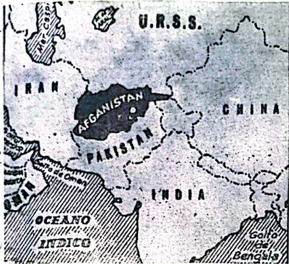
Afganistán: punto crítico de la política internacional y motivo de real ocupación para Waldheim.