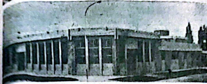
El gabado se puede apreciar en forma completa el frente del nuevo edificio de la casa del Banco de Entre Ríos, en toda la amplitud de su moderna arquitectura.

El sábado pasado al mediodía tuvo lugar en la ciudad de Viale el acto de inauguración del nuevo edificio de la sucursal del Banco de Entre Ríos. El acto fue concurrido por todos los señores de la técnica arquitectónica y de seguridad y contó con la presencia de un verdadero representante a la belleza edilicia de dicha localidad. La ceremonia contó con la presencia del ministro de Asuntos Sociales, arquitecto E. Bertelot,