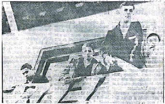
Felices saludan desde un balcón del edificio donde se alojaron en Alemania Federal, varios de los norteamericanos liberados de su denigrante cautiverio en Irán, quienes han revelado los malos tratos psíquico-físicos a que fueron sometidos durante su secuestro en poder del régimen del Ayatollah Khomeini. Incluso más de una vez —según sus denuncias— fueron sometidos al torturante juego de aterrizarlos con la llamada "ruleta rusa".

"Si esto es cierto —prosigue Rojas— porque tan insólita condescendencia para con el adversario litigioso que tan lejos de los buenos modales diplomáticos y elementales deberes que la cortesia impone a los dueños de casa con sus visitantes, había actuado en el asombroso episodio del Puerto Montt frente al presidente de la República Argentina cuya tolerancia y paciencia, excediendo los límites de rigor, evitaron un serio traspás en las negociaciones bilaterales a costa de un notorio desuicimiento