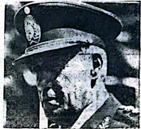
Teniente General Leopoldo F. Galtieri

Daniel Valencia, Jorge Gordillo y Patricio Hernández, completan la lista de 23 jugadores que, a las órdenes de César Menotti, comenzarán a trabajar en la Villa Marista, en Mar del Plata a partir del 15 de febrero próximo.