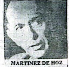
MARTINEZ DE HOZ

ficaciones o implementaciones necesarias". Como ejemplo de esto, citó a "las tasas de interés que hacen insostenible el aparato productivo del país". Adelantó además que "vamos a brindar el apoyo conveniente tanto al campo como a la industria argentina".