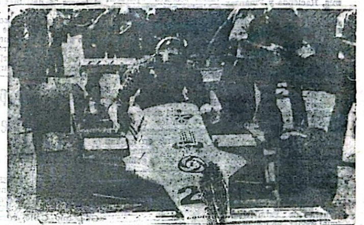
CARLOS ALBERTO REUTEMANN

5º Eddi Chever, 2 puntos; 2º Carlos Reutemann, 6 puntos; 3º Nelson Piquet, 4 puntos; 4º Mario Andretti 3 puntos; La próxima competencia será el gran premio de Brasil, el 29 de marzo en el circuito Yacaré Pa- guá de Río de Janeiro.