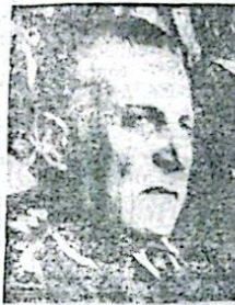
ROBERTO EDUARDO VIOLA

WASHINGTON.— Al finalizar la entrevista que mantuvo con el presidente de Estados Unidos por el término de una hora, el general Viola