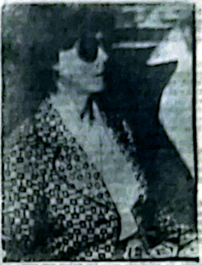
La foto fue tomada el 13 por la tarde, poco después que la expresidenta María M. de Perón arribara al palacio de justicia, donde se le informó el fallo de los jueces sobre los procesos que se le seguían.

En la misma medida en que había ocurrido dentro de la provincia de Entre Ríos, frente a los Tribunales, a las 17 fue trasladada desde su residencia particular la enjuiciada, para que oyera la sentencia. Su presencia pasó desapercibida dado el rápido ingreso de la misma y de quienes la acompañaban y vigilaban al palacio de justicia. Sólo 15 minutos duró el trámite judicial tras el cual se hizo abandono de aquél con el mismo sigilo, que sólo permi-