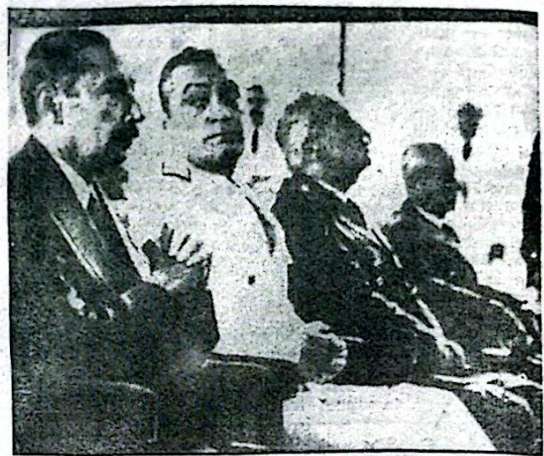
ANIVERSARIO.- En recordación del 5º aniversario de la iniciación del proceso militar, el 24 el presidente Videla y miembros de la Junta Militar, asistieron a la misa celebrada en la capilla Stella Maris de la capital federal.

La oportunidad existe y no aprovecharla sería un lamentable error, pero para que ella no se malogre es preciso actuar sin pérdida de tiempo, con el deber de persuasión que exige la conveniencia que se pone y con la imaginación creadora que dé la solución buscada. Un interés que mueva a otro interés, es la adecuada solución para el caso.