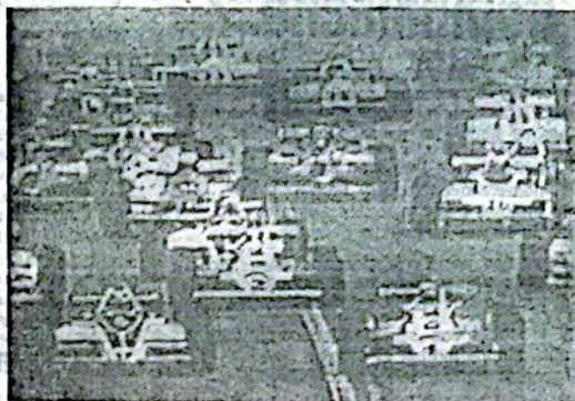
Largada del Gran Premio F-1 de la República Argentina

1º Carlos Reutemann con 21 puntos; 2º Alan Jones con 18; 3º Nelson Piquet con 13; 4º Ricardo Patrese y Alain Prost, con 4. La próxima competencia será el 3 de mayo, en el circuito de Imola, Italia.