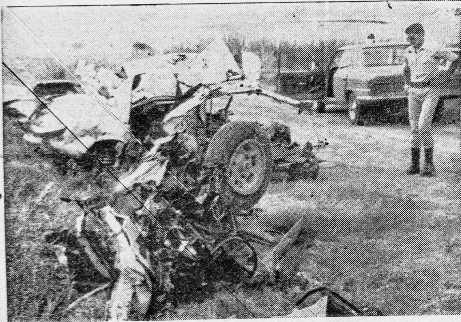
Totalmente destrozado resultó el Peugeot 504, que se estrelló en ruta 14. El saldo ocho muertos y un herido.

Una de las tragedias más impresionantes de cuantas hayan ocurrido en los últimos tiempos en los caminos de Entre Ríos aconteció sobre el mediodía del martes en la ruta 14 que digamos de paso, se está acercando a la triste celebración de las carreteras que une Buenos Aires con Mar del Plata. Porque tanto en ésta como en la similar entrerriana que acabamos de mencionar, difícilmente transcurra un día sin que haya que lamentar algún hecho luctuoso, en el cual generalmente la imprudencia juega un papel sustancial.