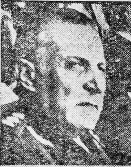
ROBERTO EDUARDO VIOLA

Estas declaraciones del general Viola fueron for-