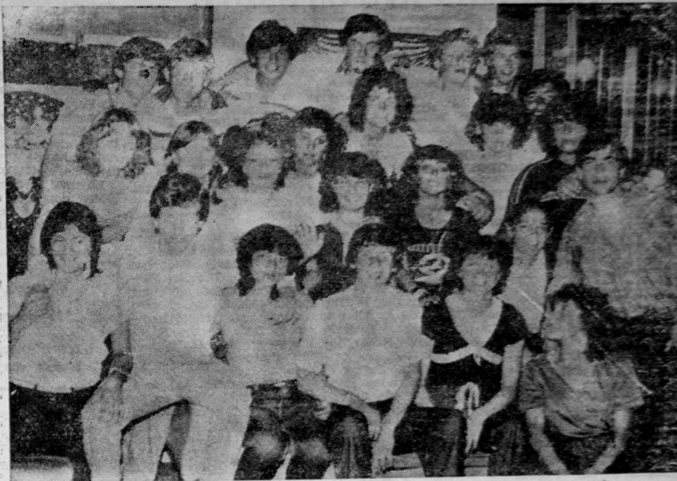
Egresados de Instituto Comercial "Francisco Ramirez"