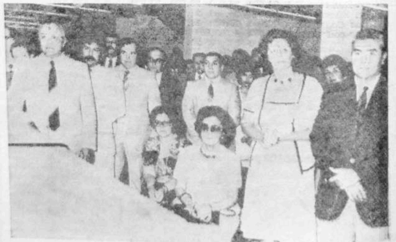
Presencias.- Numerosos vecinos se dieron cita a la inauguración del Banco Entre Ríos de Villaguay.