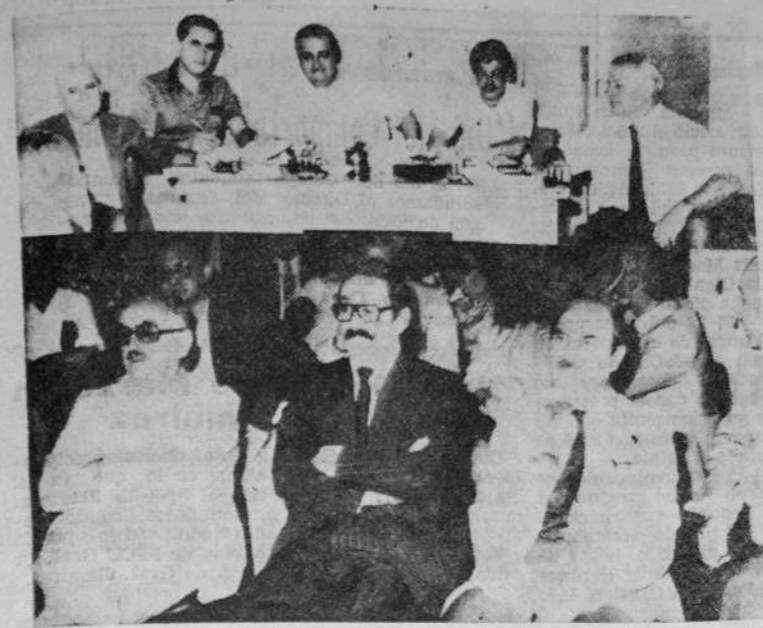
REUNION DE FARMACEUTICOS DE E. RIOS EN VILLAGUAY. El 4 se reunió en Villaguay el Colegio de Farmacéuticos de E. Rios, en un plenario de sus directivos juntamente con distintos circuitos departamentales para resolver cuestiones atinentes a la profesión sobre las Malvinas.