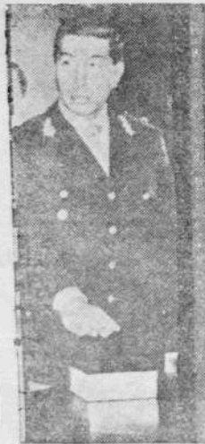
General Mario B. Menéndez, que comanda las fuerzas argentinas que defienden a Puerto Argentino en las Islas Malvinas.

Dada la extensión de torneo, se jugará todos contra todos en dos ruedas.