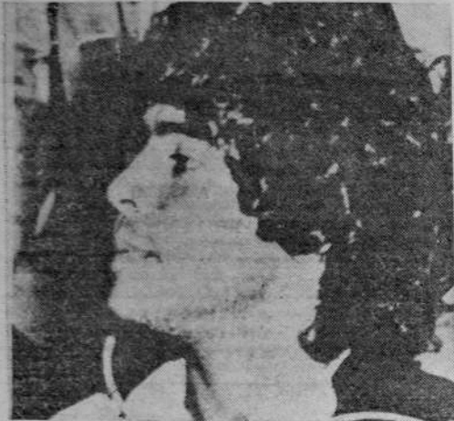
Diego Armando Maradona fue vendido al Barce' lona de España por el término de seis años y por la prima de cinco millones de dólares. Cobrará mensualmente unos 70.000 dólares, más premios y otras extras.