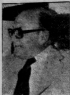
de la Nación su renuncia al cargo.