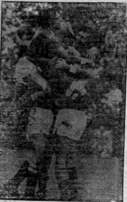
Una incidencia del partido que tras gana, Ferro por 2 a 0 a Quilmes consagró a los primeros campeones del torneo Nacional de Fútbol.

Mezclado, disciplinado con un perfecto trabajo de relevos y rotación, el equipo de Caballito fue siempre mencionado como