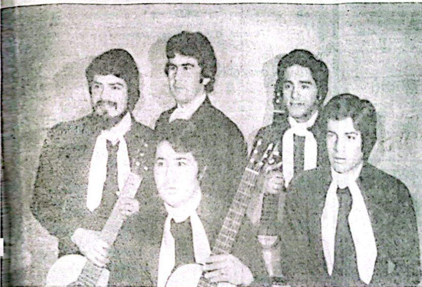
"Las Voces de Montiel"

GRAN FESTIVAL FOLKLORICO SABADO 17 DE DICIEMBRE