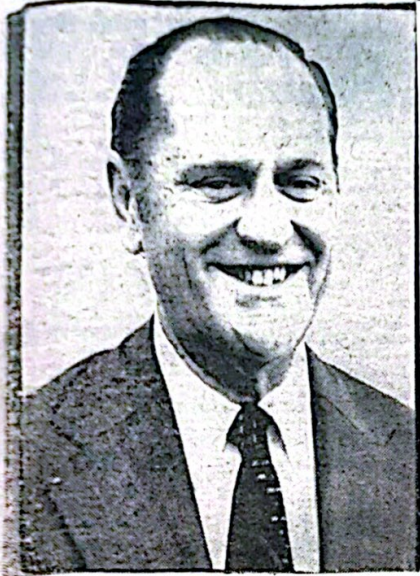
ING. MARIO BERTOZZI

Debido a algunas informaciones que se han dado, erróneas con respecto al día en que asumirá su cargo el nuevo gobernador de Entre Ríos, hemos de ratificar que el ingeniero Bertozzi será puesto en esas altas funciones por el ministro del Interior general Llamal Restón hoy viernes 25 a las 11 horas en una ceremonia que se realizará en el salón blanco de la casa de gobierno de Paraná.