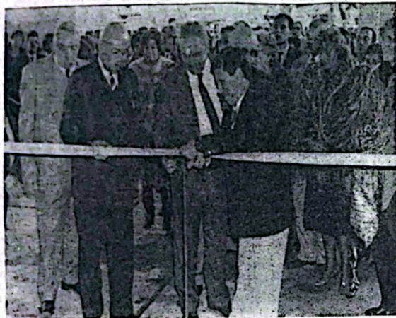
La foto documenta el instante en que el gobernador doctor Sergio Montiel procede a cortar la cinta dejando así inaugurado el flamante Instituto Integral de Rehabilitación en nuestra ciudad. Lo acompañan miembros de su gabinete, autoridades provinciales y de nuestro medio.

Quiero felicitar también a todas aquellas personas de una u otra manera permitiendo que terminara esta obra de singular importancia para la sociedad. Y quiero agradecerles nombre del gobierno de la provincia quien represento por la unidad popular, lo que es una tarea también tener nuestro presente y en el futuro, porque sabemos que de aquí en más seremos un poco más iguales, un poco más felices, un poco más libres. Nada más.