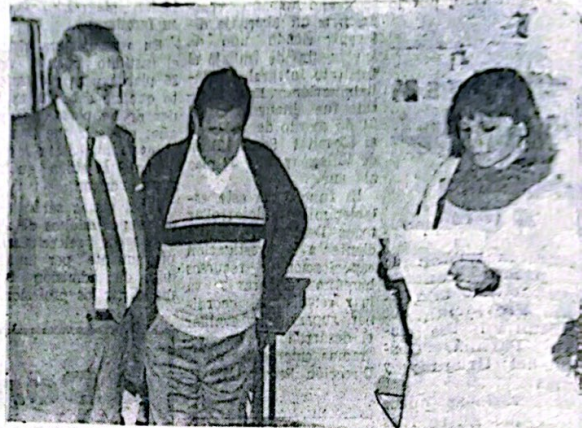
Una docente da la bienvenida al gobernador Sergio Montiel a la granja para discapacitados, ante la presencia de un miembro de la comisión que define los destinos de dicha granja y del numeroso público que asistió al acto.