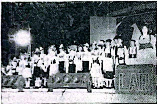
En la fotografía (arriba) el conjunto de danzas alemanas "Edelweiss" de la ciudad de Crespo, actuando en el escenario mayor del gran espectáculo artístico realizado el pasado sábado en el predio ferial de dicha localidad, en el marco de los festejos del centenario de la fundación de esa progresista ciudad entrerriana. Abajo, el grupo de danzas regionales de Italia de la Asociación Piemontesa de Rosario, que representó a la colectividad italiana en los festejos del centenario.