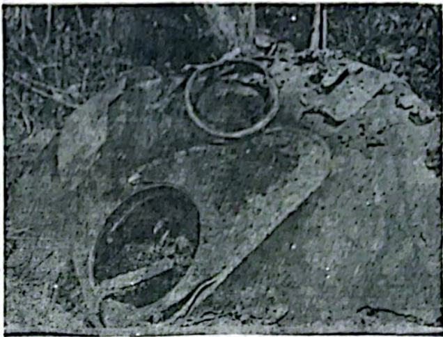
Parte de la nave espacial soviética Salyut 7, que cayó en el distrito Chafar del departamento Federal, cerca del límite con Villaguay. Tiene el tamaño aproximado de un automóvil mediano y al chocar contra el suelo hizo temblar la tierra y provocó un fuerte estruendo que se escuchó en una extensa zona a la redonda.