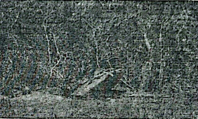
En medio de un monte espeso, característico del lugar, cayó el trozo de la Salyut 7 en un campo de la zona de Chafar Como lo revela la foto, el tremendo impacto hizo que se enterrara una buena parte en la tierra, la que calcinó por su altísima temperatura y dejó como si fuera ladrillo; además de quemar la copa de un enorme händubay y las malezas y arbustos a su alrededor.