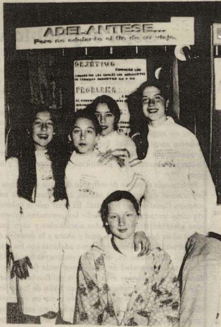
Otro de los stands de alumnos de nuestra ciudad, que obtuvieron el 11º lugar.

2º) Educación Hoy, Propuesta para Mañana . E.P.N.M. N°