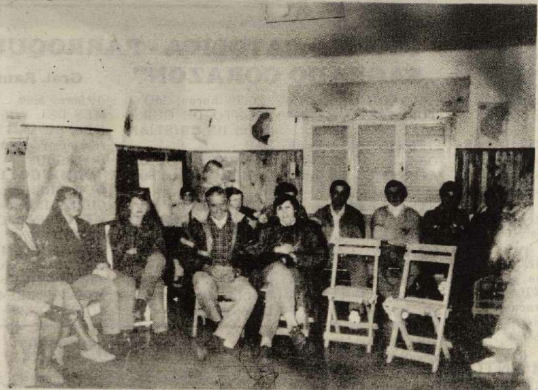
RAMIREZ - Vista parcial de la concurrencia a la reunión de Cambio Rural realizada en la Escuela Rural Primaria N° 14 de Isletas el día viernes 10 de setiembre, convocado por la Juventud Agraria Cooperativista con el fin de informar sobre el programa.