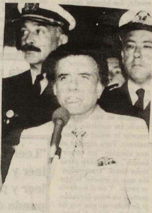
Menem haciendo uso de la palabra

El acto comenzó con la entonación del Himno Nacional Argentino y enseguida se dirigió a la concurrencia el Presidente Municipal, Dr. Humberto Ré, quien formalizó ante el Dr. Menem una serie de reclamos locales que fueron apoyados con aplausos por el público. Entre ellos: fondos para el Parque Nacional "Pre-Delta" -mencionando que había sido creado por una ley iniciativa del Dip. Parente- declaración de zona franca para el puerto de Diamante, la propalación para todo el país del Festival Nacional de Jineteada y Folklore y agilización de los trámites de transferencia de inmuebles fiscales. En otro orden de ideas, Ré expresó que tenía el privilegio de haber recibido en su anterior gestión la visita de otro Presidente (mencionando expresamente al Dr. Alfonsín), como así también-